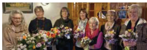
Das neue und das alte Leitungsteam